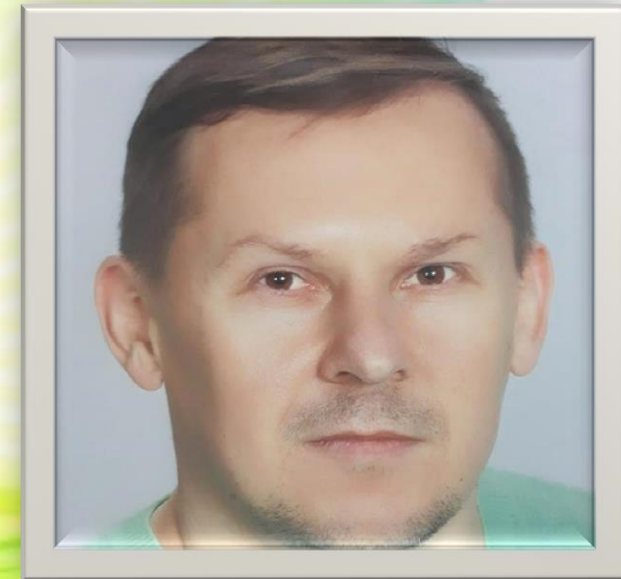
Инструктор по физической культуре